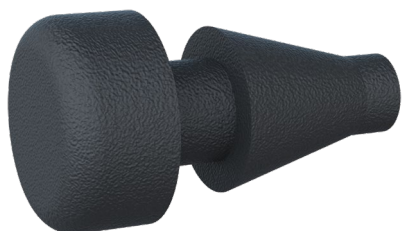
SEM CU FO

Emplacement patin PPC Location of PPC pad