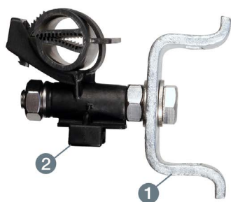
BRTV 10/2 ARP